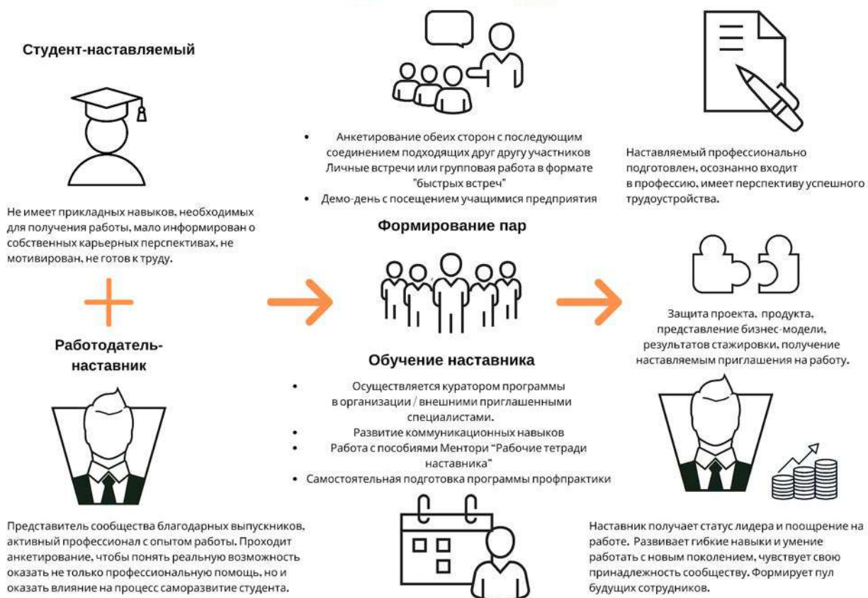
Рисунок 5. Графическое представление наставнического взаимодействия по форме «работодатель – студент»