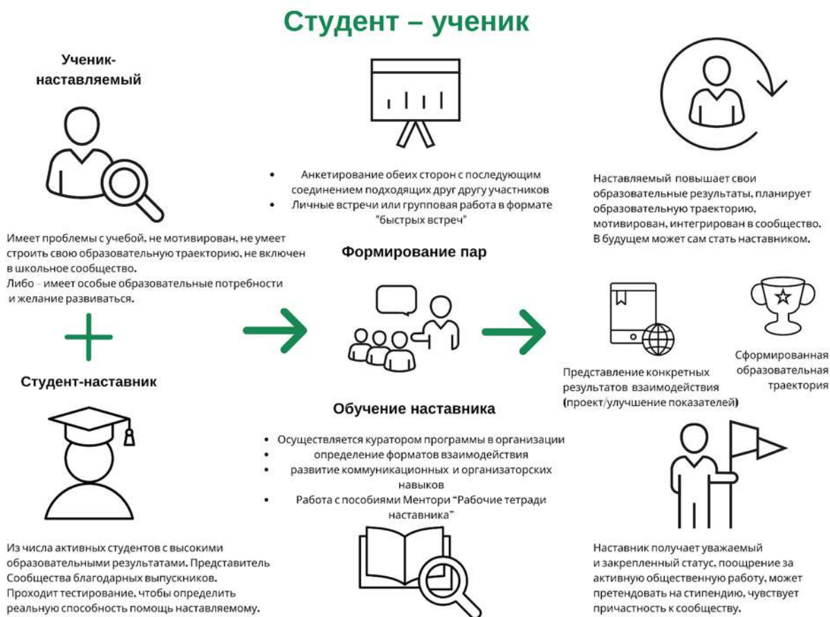
Рисунок 3. Графическое представление наставнического взаимодействия по форме «студент – ученик»