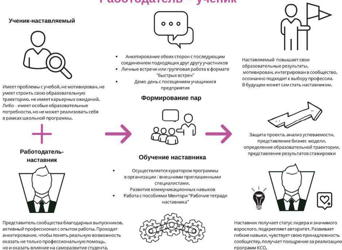
Рисунок 4. Графическое представление наставнического взаимодействия по форме «работодатель – ученик»