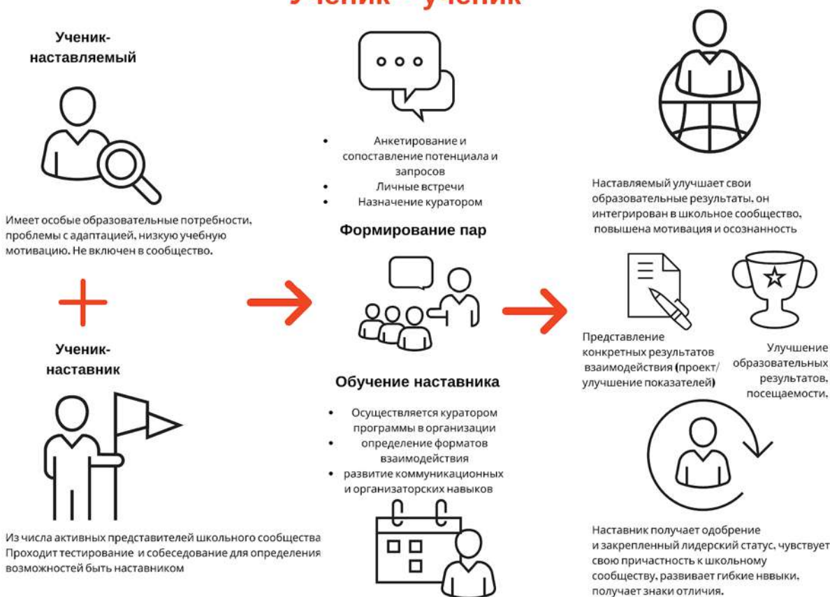
Рисунок 1. Графическое представление взаимодействия по форме «ученик – ученик»