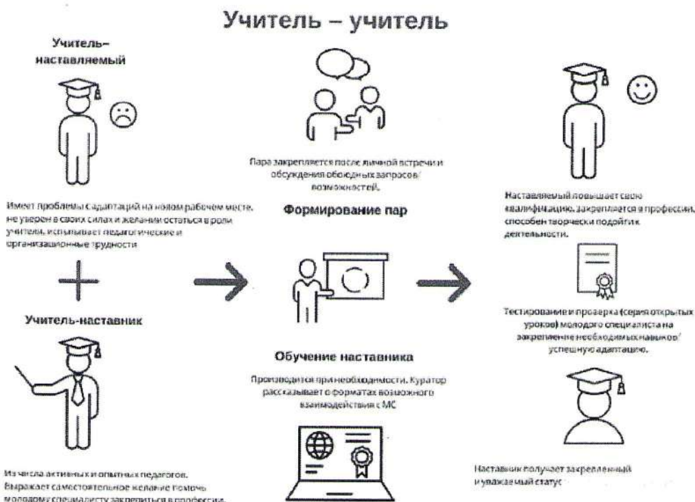
Рисунок 2. Графическое представление взаимодействия по форме «учитель – учитель»